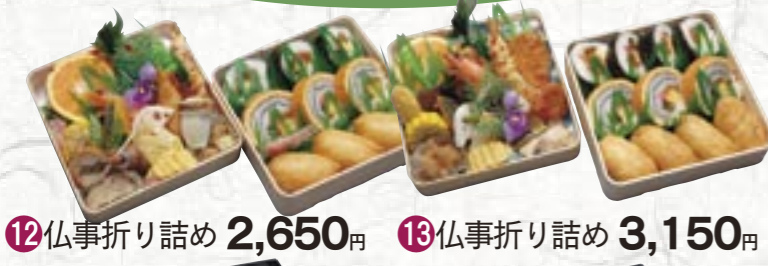
⑫仏事折り詰め 2,650円 ⑬仏事折り詰め 3,150円