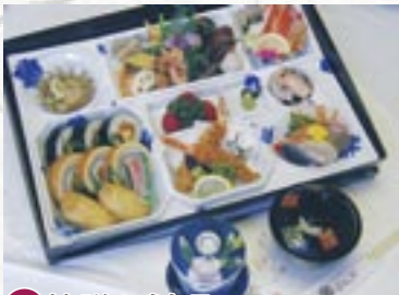
⑯箱膳お料理 (茶碗蒸し・吸い物付) 6,300円