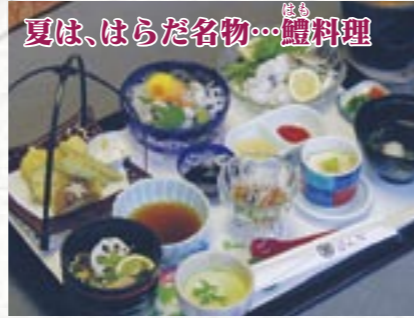
夏は、はらだ名物…鱧料理