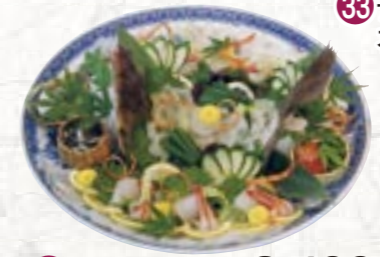
㉔ひらめ姿造り 8,400円より

◆各種パーティー、祝賀会等 寿司・オードブル・刺身のセット 各種ご予算に応じます。