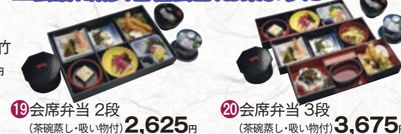
⑲会席弁当 2段 (茶碗蒸し・吸い物付) 2,625円