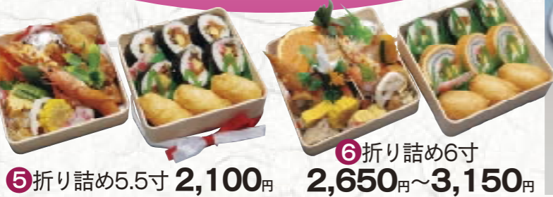
⑤折り詰め5.5寸 2,100円 ⑥折り詰め6寸 2,650円~3,150円