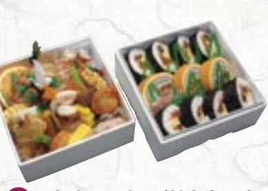
⑦お祝折り詰め(箱折)6寸 3,675円