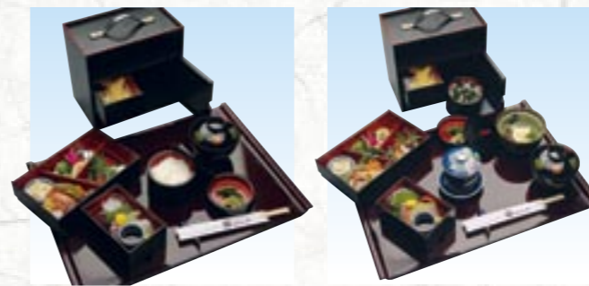
⑲野点弁当 桜 2,625円