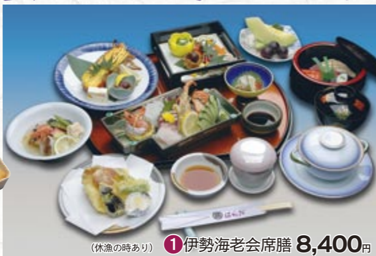
(休漁の時あり) ①伊勢海老会席膳 8,400円