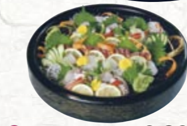
㉓お造り盛り合わせ 6,300円より