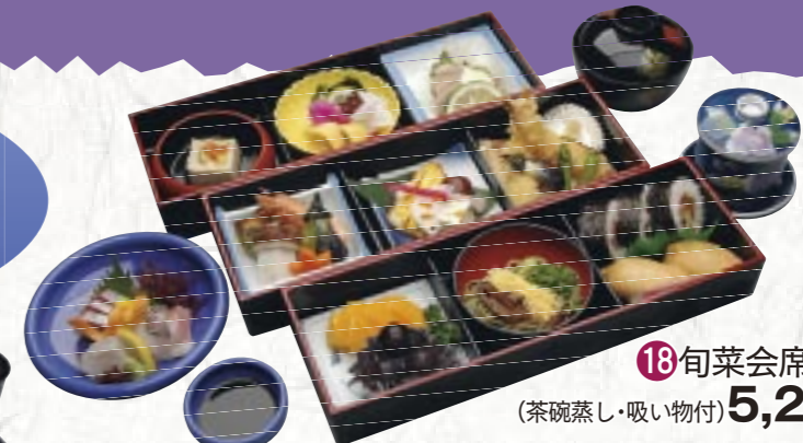
⑱旬菜会席弁当 (茶碗蒸し・吸い物付) 5,250円