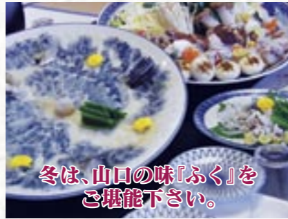
冬は、山口の味「ふく」を ご堪能下さい。