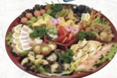
㉑テイクアウト用 オードブル 8,400円より